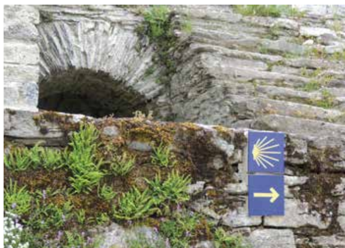
Photographie de Thierry Gridlet exposée ce mois de juin aux Ateliers Partagés